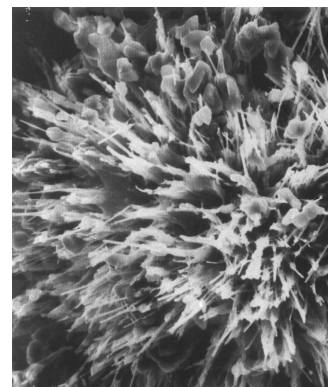
RED DE CRISTALES